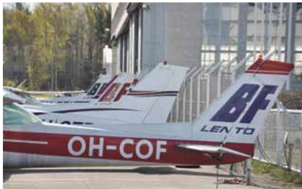
BF:n konerivistö on Malmilla tuttu näky.

HELISINGIN MEDIALUKIO (entinen Koillis-Helsingin lukio) sijaitsee Malmin lentoaseman naapurissa Tapanilassa. Kuvauskäynti kentälle järjestyi Malmin lentoaseman ystävien -yhdistyksen avulla.